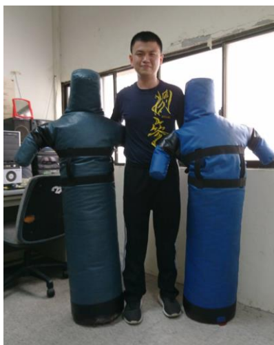
左邊沙包：男生用(40 公斤) 右邊沙包：女生用(30 公斤) 照片中學生約 170 公分高